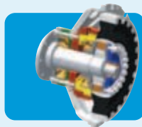
Two in one